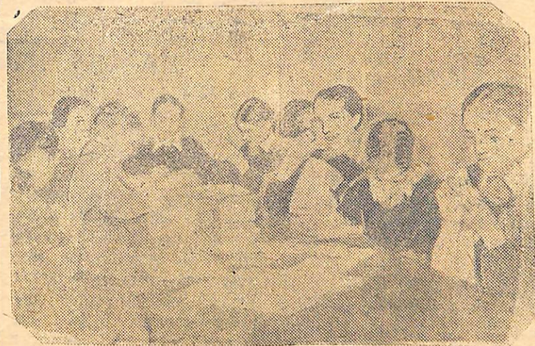
На занятиях в кружке художественной вышивки.